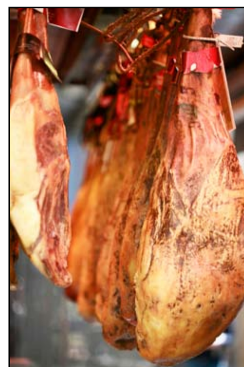
RADI PROIZVODNJE NAJSKUPLJE ŠUNKE NA SVIJETU, VRIJEDNE 1.792 KUNE ZA KILOGRAM, IBERIJSKE SVINJE BILE SU NA DIJETI I HRANILE SE VISOKOKVALITETNIM ŽIREVIMA

težine, smanjenju stresa i probavi. U to svakako vjeruju Japanci jer u tu se zemlju s Havaja svaki dan otpremi 80 tisuća boca vode Kona Nigari.