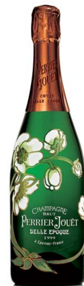
ŠAMPANJAC Perrier-Jouët Belle Epoque Blanc de Blanc S CIJENOM OD 1.500 DOLARA JEDAN OD NAJSKUPLJIH NA SVIJETU - DOLAZI U RUČNO OSLIKANOJ BOCI